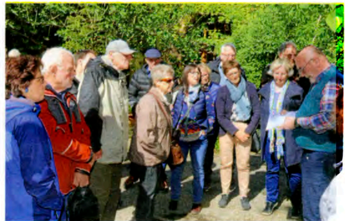
Rund 50 Interessierte waren zur Führung durch Altwiesloch gekommen.